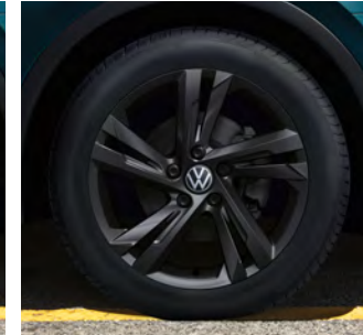
19-Zoll-Leichtmetallrad „Valencia“ in Schwarz 1 Optional für Tiguan R-Line