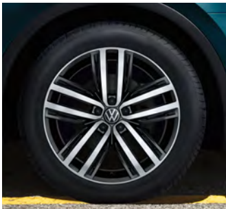
19-Zoll-Leichtmetallrad „Auckland“ in Dark Graphite 1 Optional für Tiguan Elegance