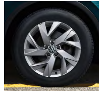
18-Zoll-Leichtmetallrad „Frankfurt“ 1 Serienausstattung Tiguan Elegance, optional für Tiguan Life