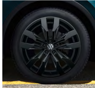
20-Zoll-Leichtmetallrad „Suzuka“ in Schwarz 1 Optional für Tiguan R-Line