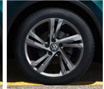
19-Zoll-Leichtmetallrad „Valencia“ in Grau Metallic 1 Serienausstattung Tiguan R-Line