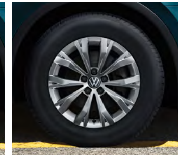
17-Zoll-Leichtmetallrad „Montana“ 1 Serienausstattung Tiguan