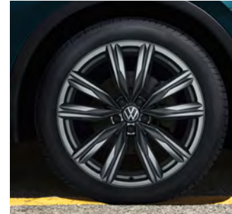
20-Zoll-Leichtmetallrad „Kapstadt“ in Grau Metallic 1 Optional für Tiguan Elegance