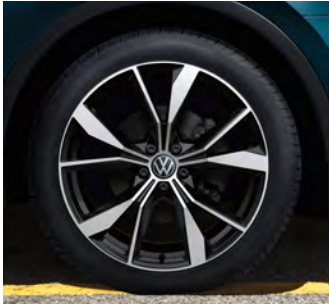
20-Zoll-Leichtmetallrad „Misano“ 1 Optional für Tiguan R-Line