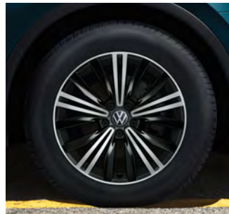
18-Zoll-Leichtmetallrad „Nizza“ 1 Optional für Tiguan Life und Tiguan Elegance