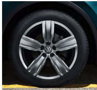
19-Zoll-Leichtmetallrad „Victoria Falls“ 1 Optional für Tiguan Life und Tiguan Elegance