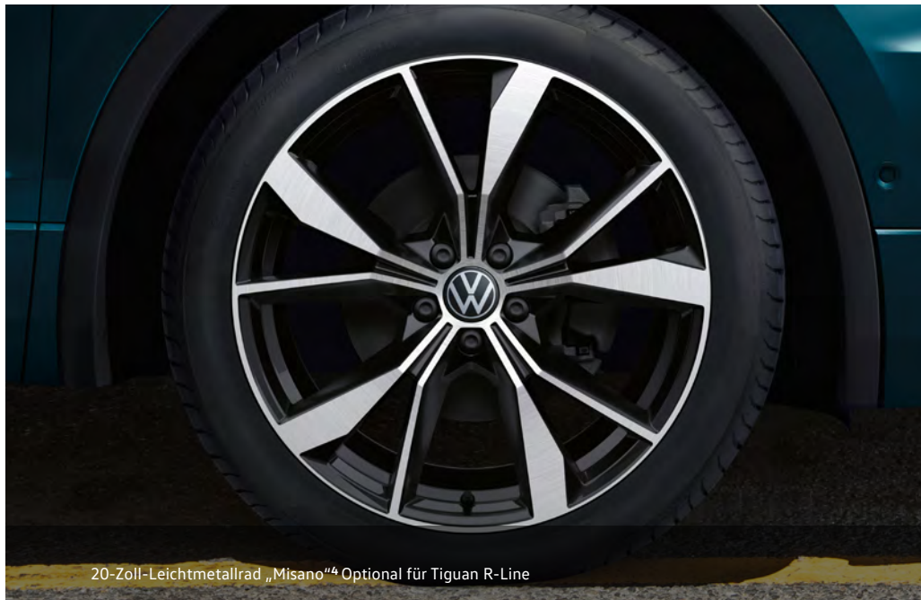
20-Zoll-Leichtmetallrad „Misano“ 4 Optional für Tiguan R-Line