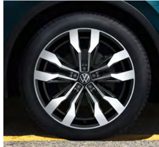
20-Zoll-Leichtmetallrad „Suzuka“ 1 Optional für Tiguan R-Line