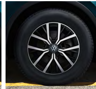
17-Zoll-Leichtmetallrad „Tulsa“ 1 Serienausstattung Tiguan Life, optional für Tiguan